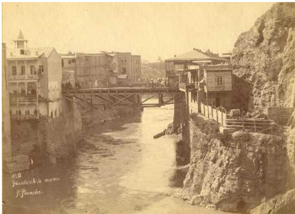
ილ.7 ავლაზრის ხეობა