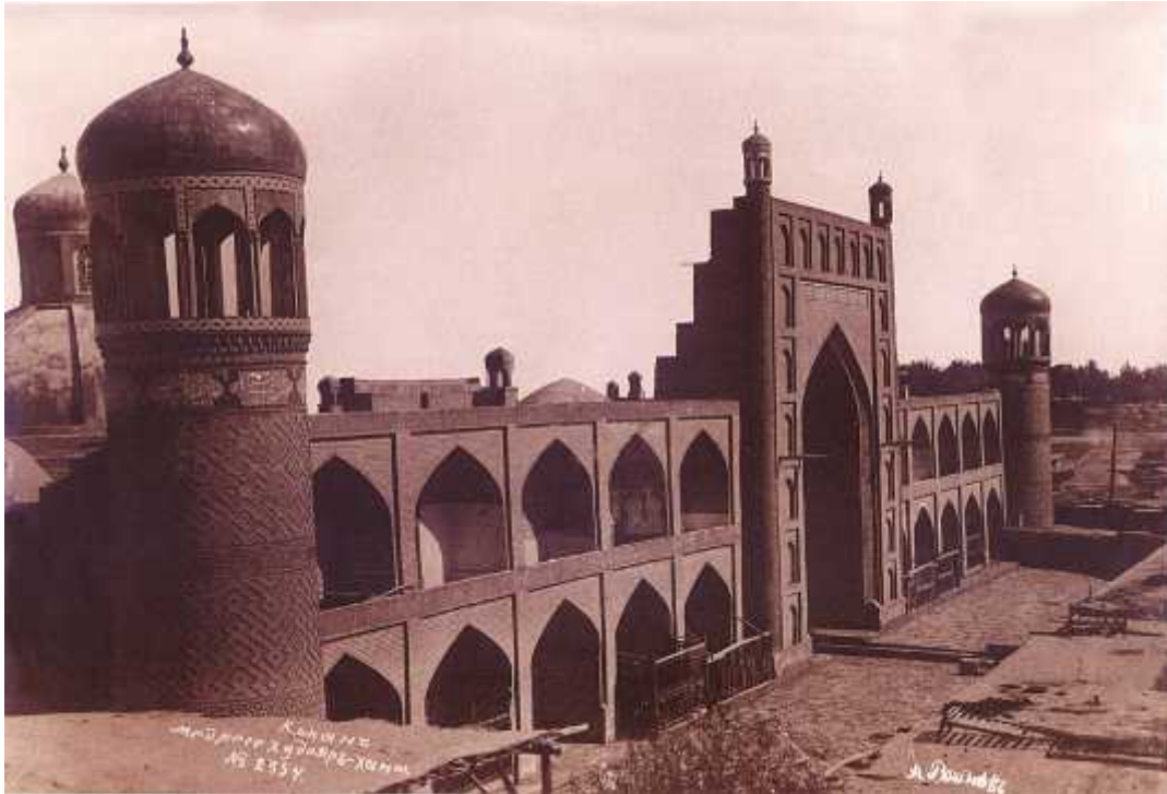
ილ. 18 შუა აზია. კოკანი. ხუდაიარ-ხანის მედრესე