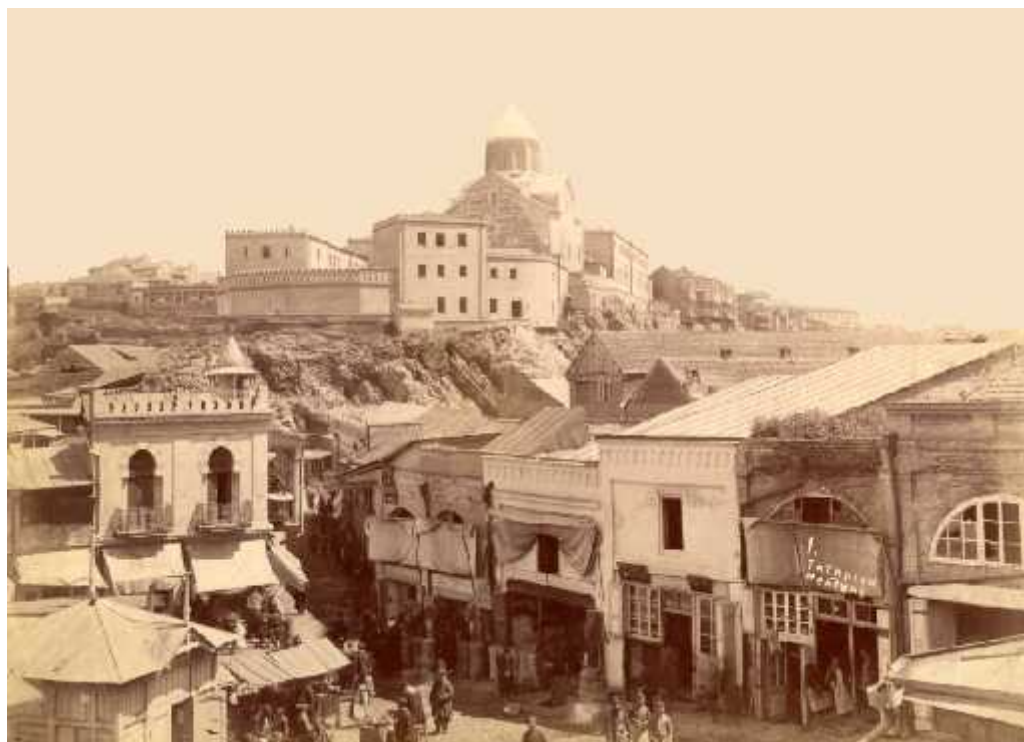
ილ.8 თათრის მაყდანი