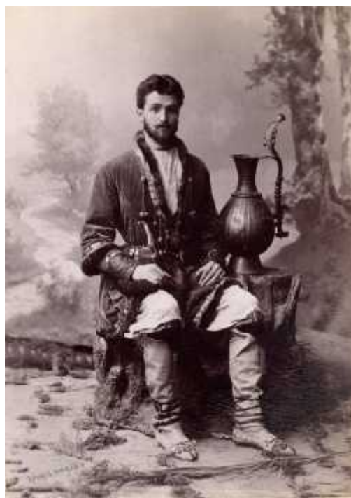
ილ. 12 ქართველი მამაკაცი ბასრას დოქით