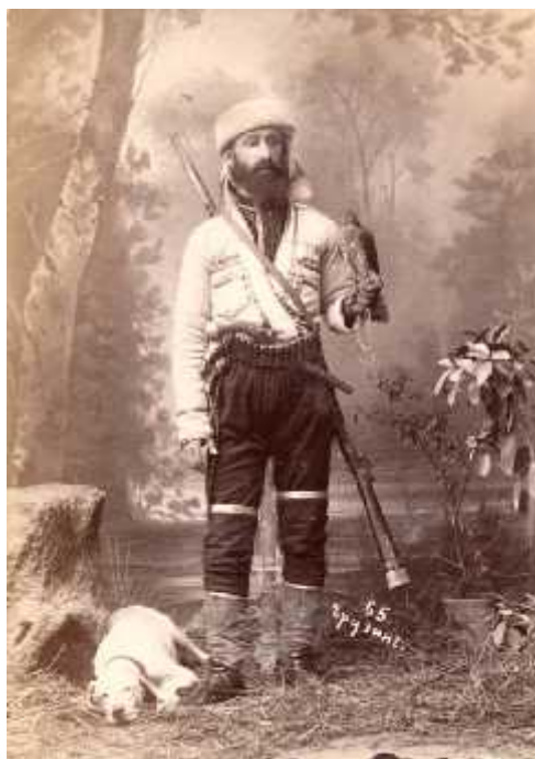
ილ. 11 ქართველი მამაკაცი