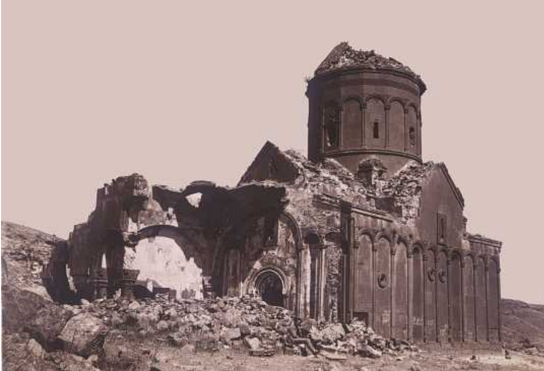
ილ. 17 სომხეთი, დანგრეული ტაძარი