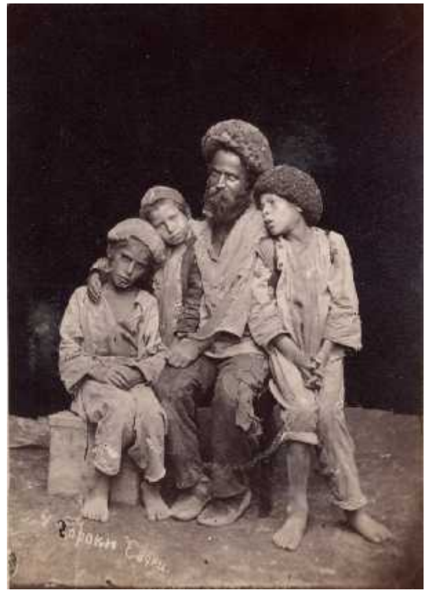
ილ.16 დაღესტანი, მთის ებრაელები