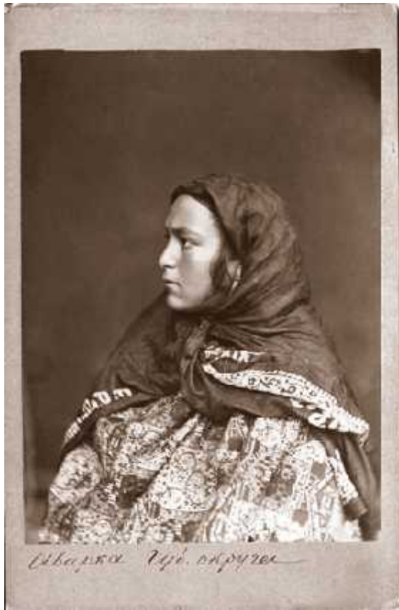
ილ. 15 დაღესტანი, ავარელი ქალი