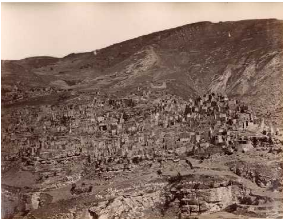
ილ. 14 დაღესტანი