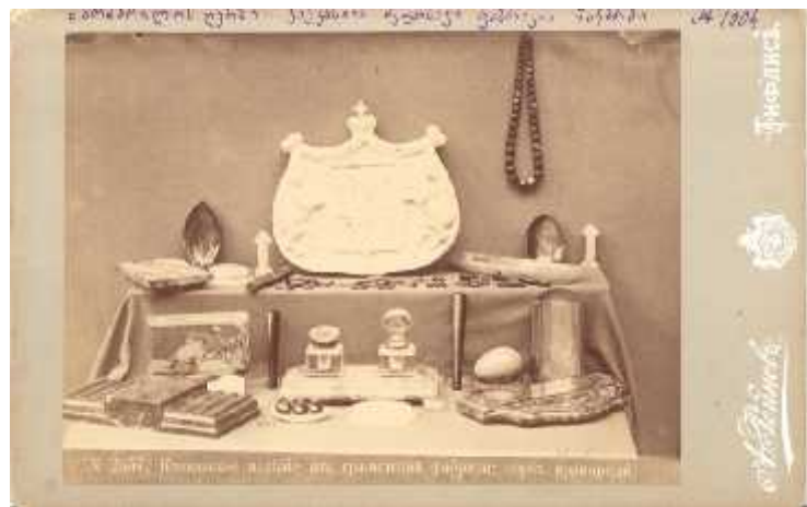
ილ. 19, 20. ალ. როინაშვილის სამუზეუმო ნივთები