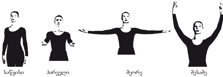
სურ. 3. ხელის პოზიციები

III პოზიცია – ორივე ხელი თავს ზევით აწეული, იდაყვებში ოდნავ მოხრილი, ხელის მტევნები გამართული, ნები შიგნით, თითები თავისუფლად (სურ. 3).