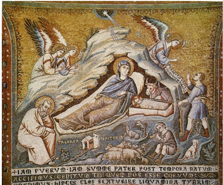
პიეტრო კავალინი (1240-1330), იესოს დაბადება – მოზაიკა, სანტა-მარია ტრანსტევერეში, რომი.

რაც შეეხება ფერებს, ფრესკაში გამოყენებული ნათელი ფერები და სინათლის ეფექტები, რაც სცენას სიცოცხლესა და დინამიკას ანიჭებს. განსაკუთრებით გამორჩეულია ანგელოზების გამოსახულებები, რომლებიც შუქით არიან მოცულნი.