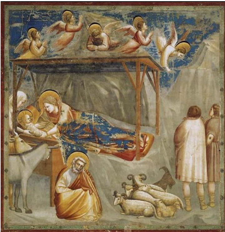
ქრისტეს შობა, ჯოტო დი ბონდი. კაპელა დელ არენას ფრესკა. 1304-1306 პადუა, იტალია

„შობა“ ერთ-ერთი უმნიშვნელოვანესი დღესასწაულია, რომელიც თორმეტ საუფლო დღესასწაულს შორისაა. „შობა“ განსაკუთრებით პოპულარული თემაა ხელოვნებაში და წამყვანი ადგილი უკავია შუა საუკუნეებში.